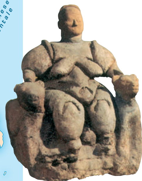
▲ Statuetta in terracotta di Dea Madre VI millennio a.C. (Çatal Hüyük) I culti della fertilità avevano un'importanza fondamentale nelle civiltà agricole arcaiche, la cui sopravvivenza e prosperità era legata all'abbondanza dei raccolti.

In alcuni casi i villaggi raggiunsero dimensioni e caratteristiche costruttive tali da essere paragonabili a proto-città , cosiddette in quanto prive della più complessa organizzazione economica e politico-amministrativa pertinente alle città propriamente dette. Tra le più antiche proto-città rientrano l'insediamento di Çatal Hüyük (Anatolia), risalente al 6250 a.C., e quello di Gerico (Palestina), risalente all'VIII millennio a.C.