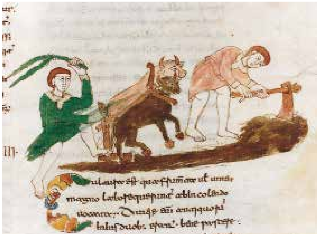
Prima zappare poi arare, inizio XI sec.

1. Rileggi attentamente le pagine del manuale soffermandoti in particolare sulle principali innovazioni legate allo sfruttamento della terra nel secolo XI ed elencale nel riquadro qui di seguito: